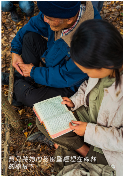
寶兒將她的秘密聖經埋在森林的樹根下。