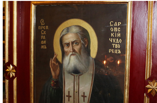
哈薩克阿拉木圖的俄羅斯東正教堂