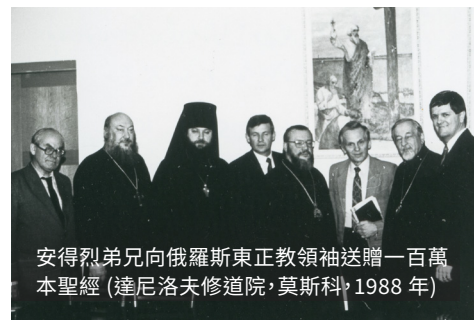
安得烈弟兄向俄羅斯東正教領袖送贈一百萬本聖經 (達尼洛夫修道院, 莫斯科, 1988年)

我們一點一點地看到當局態度的變化。我認為神賦予了戈爾巴喬夫這個角色，神使用他打開帷幕，就是那道封閉蘇聯的鐵幕。