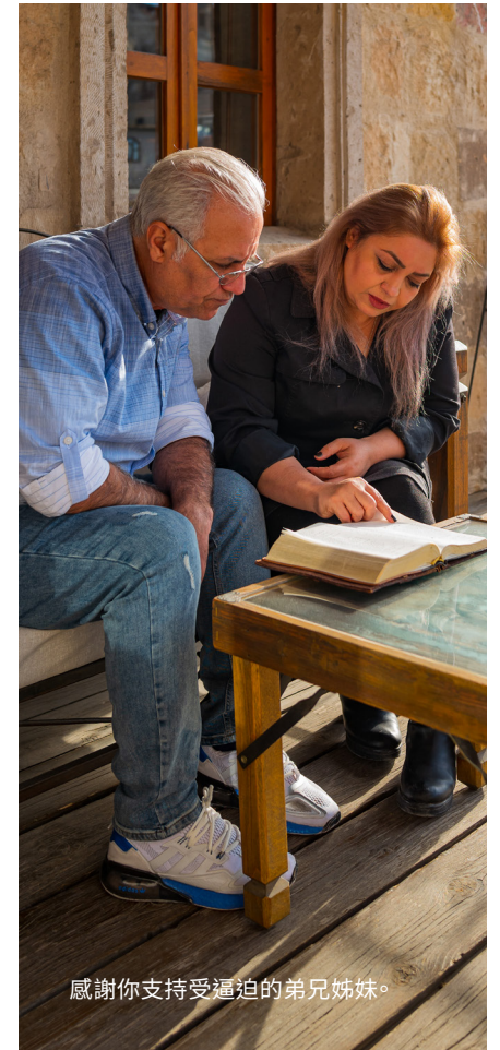
感謝你支持受逼迫的弟兄姊妹。