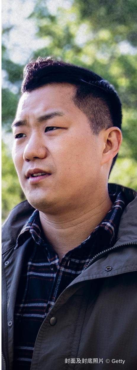
封面及封底照片