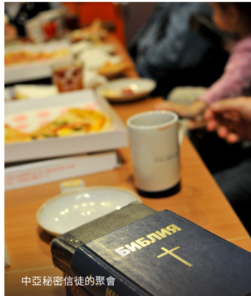
中亞秘密信徒的聚會