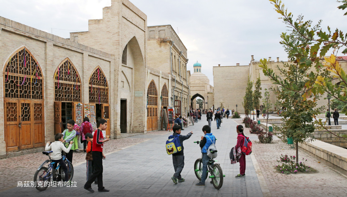
烏茲別克的坦布哈拉

“魚缸裡的魚”隨之而來的是淪為二等公民、被社會排斥、權利受到限制的挑戰，凡此種種都大大地窒礙事業發展。進入大學幾乎是不可能的，從政或進入政府架構更是妄想。這都是我們在蘇聯時期作為基督徒必須面對的。