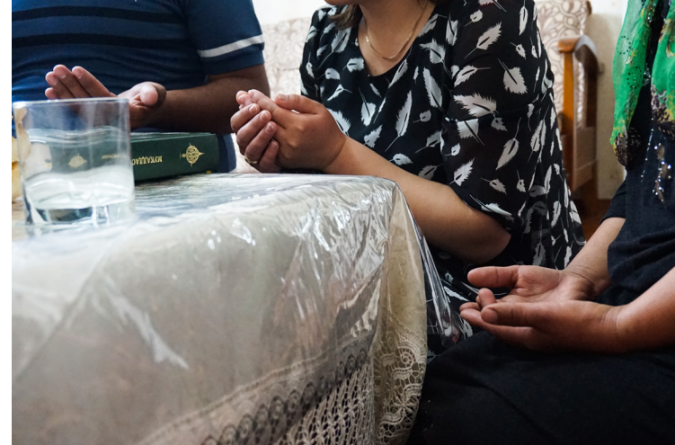
中亞秘密信徒的聚會