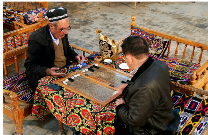
烏茲別克的年長男士在玩雙陸棋