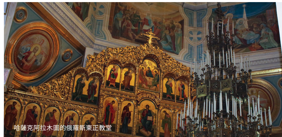
哈薩克阿拉木圖的俄羅斯東正教堂

就我個人而言，那日子讓我變得更堅強。我們靠祈禱支撐著，與主耶穌的溝通是無比重要的。